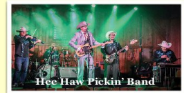
Hee Haw Pickin' Band